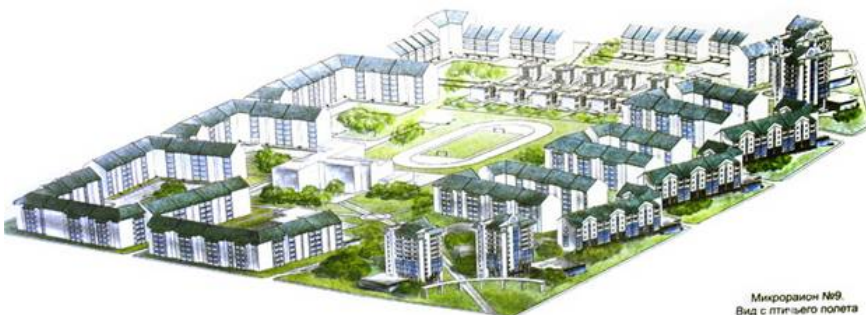
Микрорайон №9 Вид с птичьего полета

Блок №1 - 160-этажный, 10000 кв.м., 11 кв.м.,